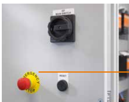
SM/CC: Маркировка на клейкой основе – уверенность в том, что устройства будут использоваться правильно