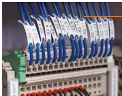
WM: Маркировка для проводов монтируется без инструментов – отформатировать план-проект на компьютере и пустить рулон на печать