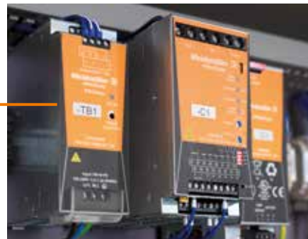
ESG: Идентификация любого оборудования - простая маркировка для быстрого распознавания компонентов