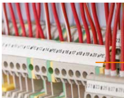
DEK/WS: Маркировка для клемм – напечатал, установил – готово