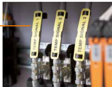
SFX: Кабельная маркировка с фиксацией стяжками