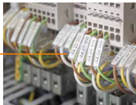
TM-I: провод легко вставляется в маркировочную муфту до или после монтажа