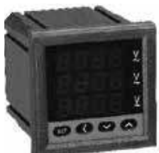
PA/PZ7777-S Трехфазный цифровой амперметр, вольтметр