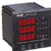
PD7777-S4 Трехфазный цифровой многофункциональный измеритель