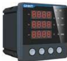
PD666-S4 Трехфазный цифровой многофункциональный измеритель