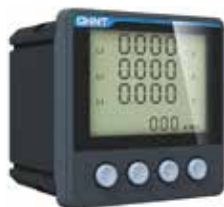
PD666-S3 Трехфазный многофункциональный измеритель с ЖК-дисплеем