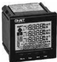
PD7777-S3 Трехфазный цифровой многофункциональный измеритель с ЖК-дисплеем